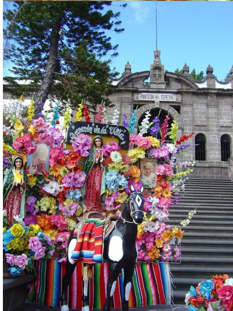
Ciudad de México, Tepeyac, Virgen de Guadalupe