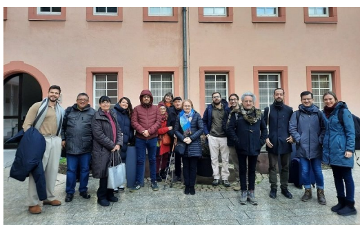
Encuentro de becarios y becarias en Maguncia